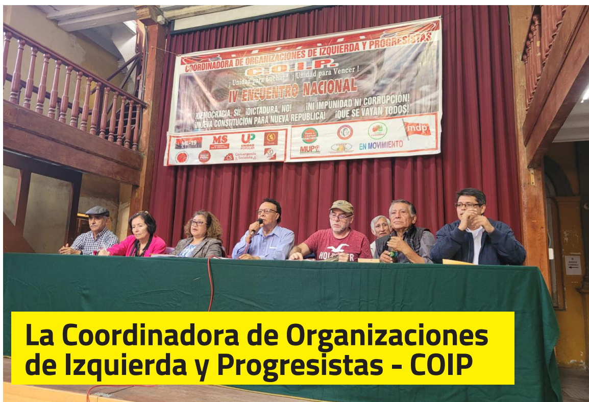
La Coordinadora de Organizaciones de Izquierda y Progresistas - COIP