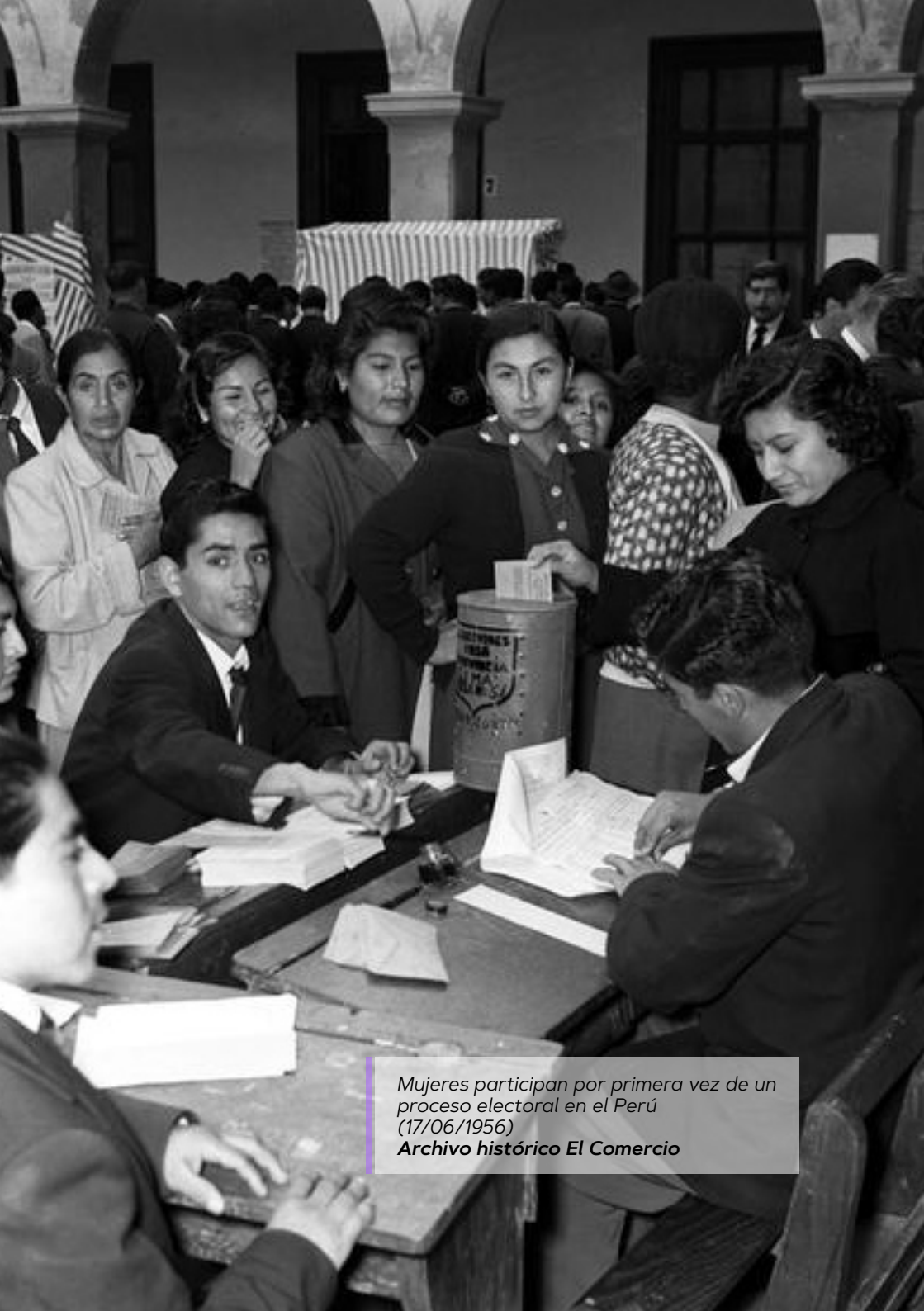
Mujeres participan por primera vez de un proceso electoral en el Perú (17/06/1956)