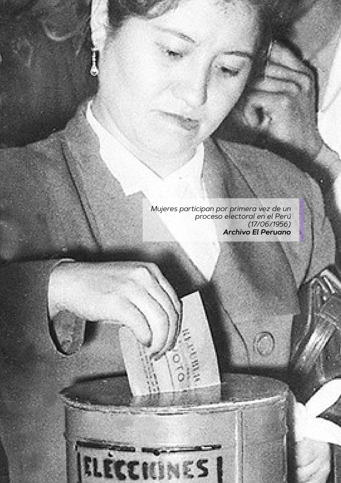
Mujeres participan por primera vez de un proceso electoral en el Perú (17/06/1956)