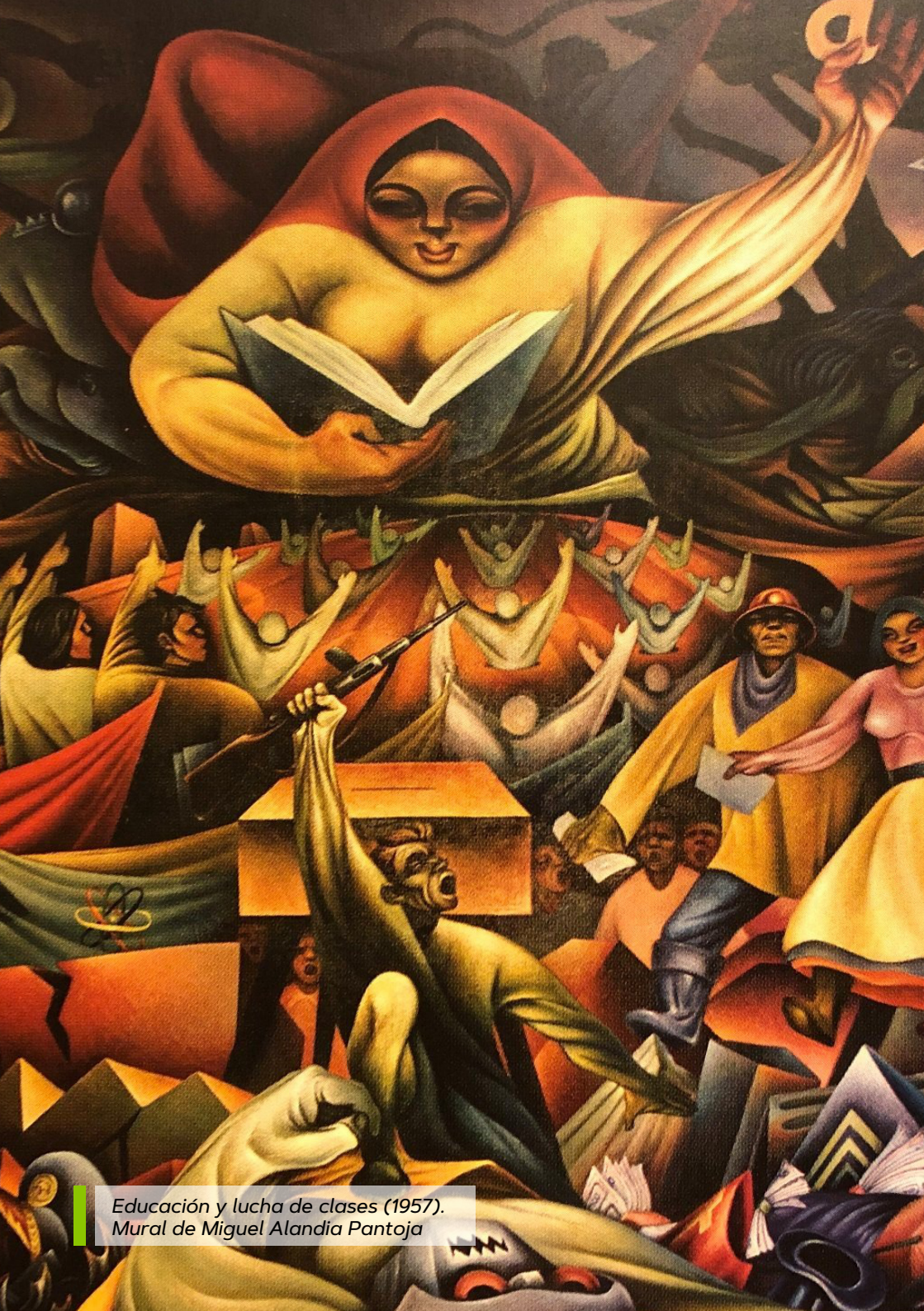
Educación y lucha de clases (1957). Mural de Miguel Alandía Pantoja